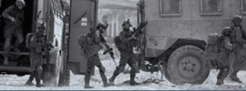
Photo ci-dessous :

En décembre 2023, Vladimir Poutine était reçu en Arabie saoudite et aux Émirats arabes unis, à l'occasion d'un déplacement au Moyen-Orient. Depuis, le président russe a rencontré à deux reprises son homologue syrien Bachar el-Assad, en mars puis en juillet 2024, afin d'évoquer l'escalade des tensions dans la région et aux frontières syriennes.