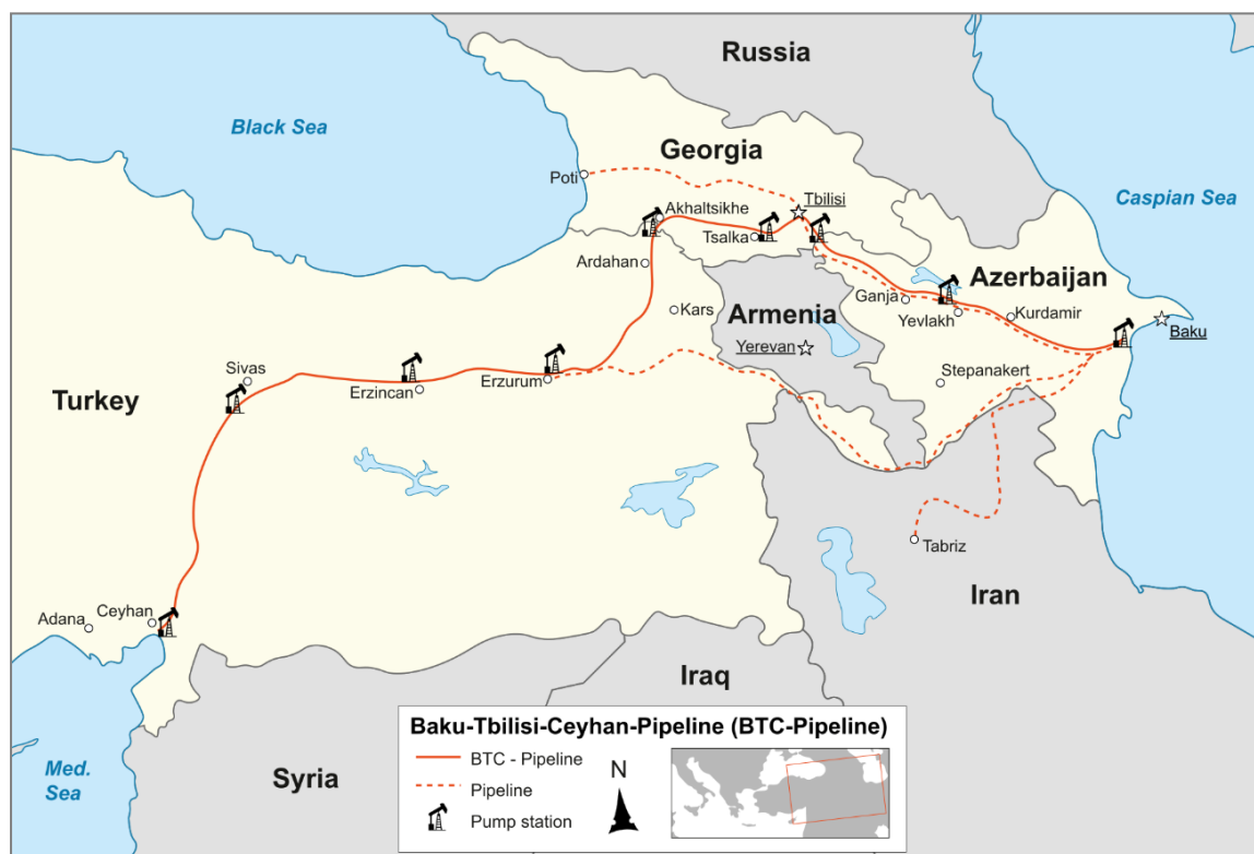
Carte 2. Oléoduc Bakou-Tbilissi-Ceyhan (BTC)