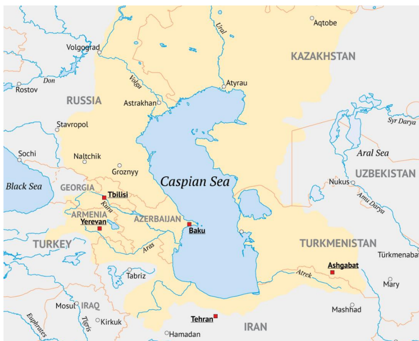
Carte 1. La région de la mer Caspienne

La surface en jaune indique la zone de drainage approximative autour de la mer Caspienne.